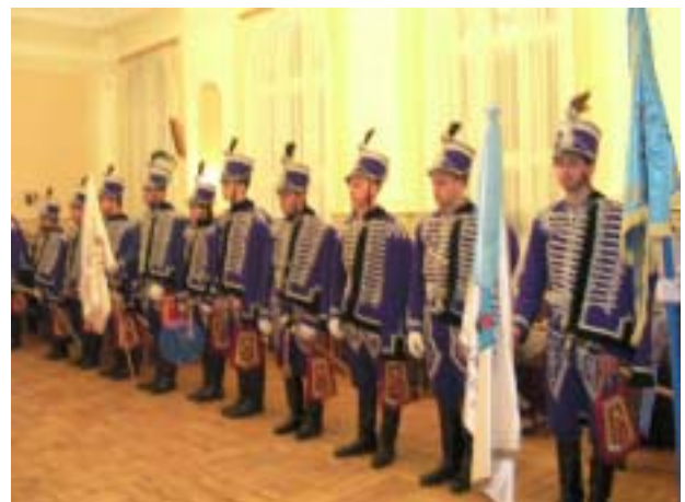
A Nagykun Lovasbandérium tagjai