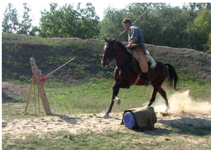
A kun viadal nézői igazi küzdelmet láthattak